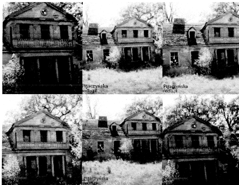
Fot. 1. Dworek w Wistce Królewskiej.

Dzisiaj dworek w Wistce Królewskiej, który w 1991 roku został wpisany do rejestru zabytków pod numerem 282/A.